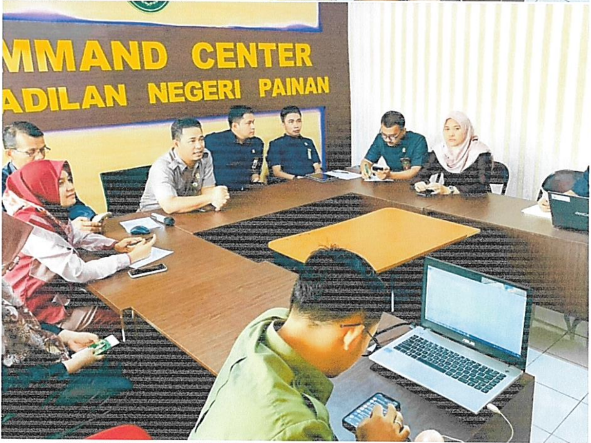
DOKUMENTASI RAPAT PENYUSUNAN INDIKATOR KINERJA UTAMA TAHUN 2022